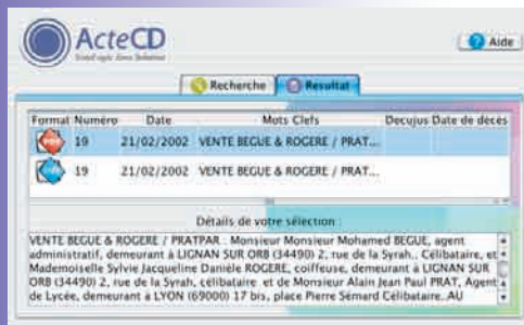
Résultat rapide, détaillé, en TIFF ou PDF...