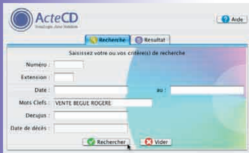
Recherche par mots clefs...